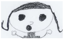
幼児部の友だちの作品